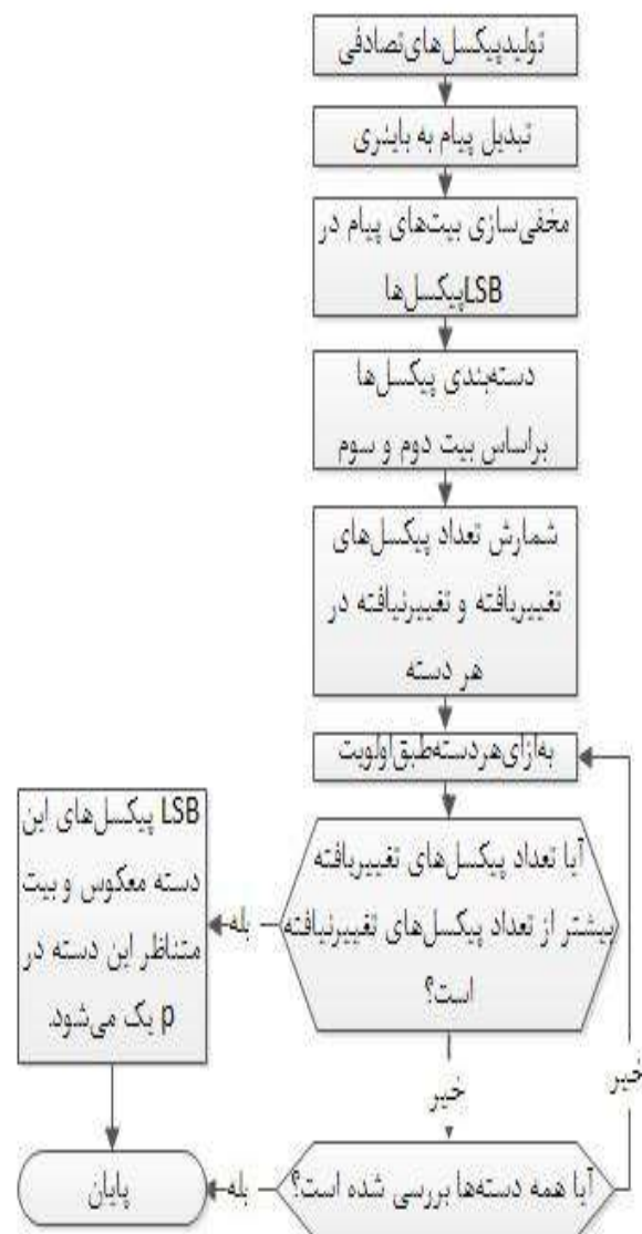
(شکل-۲): چارت روش دسته‌بندی پیکسل‌ها براساس بیت دوم و سوم کم‌ارزش آنها

بیت‌های پیام در کم‌ارزش‌ترین بیت هر پیکسل جاسازی می‌شود؛ سپس به‌منظور کاهش تغییرات، LSB نخستین دسته با بیش از ۵۰٪ تغییرات، معکوس می‌شود. چارت این روش در شکل (۲) آمده است. یکی از عیب‌های این روش، اولویت‌دهی به دسته‌ها است. دسته‌ها براساس اولویت بررسی می‌شوند و LSB نخستین دسته با شرط بالا، معکوس می‌شود.