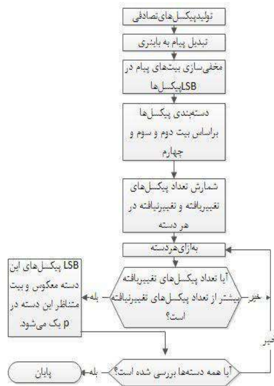
(شکل-۳): چارت مخفی‌سازی پیام

علاوه بر پیام، آرایه p نیز همراه پیام ارسال می‌شود. بعد از اعمال تغییرات در آرایه p ، آن را همراه با پیام در پوشانه مخفی می‌کنیم. در مخفی‌سازی ابتدا بیت‌های آرایه p (۸ بیت) و سپس بیت‌های پیام محرمانه مخفی می‌شوند. با استفاده از این روش، تعداد تغییرات نسبت به روش مرجع [۱۶]، بهبود یافته آن و LSB ساده کمتر شده و نتایج قابل قبولی ارائه می‌دهد که نتایج در بخش آزمایش‌ها ذکر شده است.