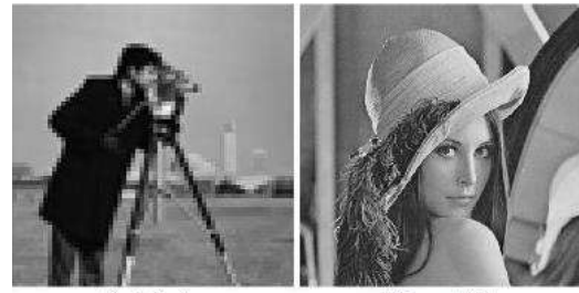
(الف) تصویر پوشانه (ب) پیام محرمانه

در روش مرجع [۱۶]، دسته‌بندی پیکسل‌ها براساس بیت دوم و سوم کم‌ارزش پیکسل‌ها انجام شده بود که مشکلاتی داشت. با رفع مشکلات و بهبود روش مذکور، روشی مبتنی بر دسته‌بندی پیکسل‌ها براساس بیت دوم، سوم و چهارم، بیت‌های کم‌ارزش پیکسل‌ها، در این مقاله، ارائه شد که میزان تغییرات را به حداقل رساند.