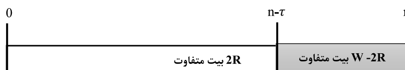
(شکل-۳): شکل گرافیکی الگوریتم پیدا کردن نزدیک-برخورد با استفاده از حافظه کم [10].