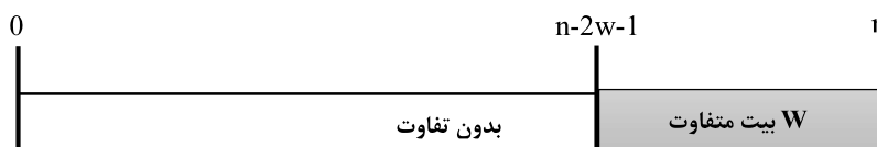
(شکل-۲): شکل گرافیکی یک الگوریتم پیدا کردن نزدیک-برخورد [10].

نخستین الگوریتم تعمیم ساده روش مبتنی بر کوتاه‌سازی در بخش ۵ است. مشاهده شد که اگر \tau بیت با 1 > 2w برش داده شود، احتمال این که یک برخورد در تابع کوتاه‌شده یک نزدیک‌برخورد در تابع چکیده‌ساز کامل باشد، به‌سرعت کاهش می‌یابد و نیاز به پیدا کردن برخوردهای بسیاری دارد. در یک رویکرد حقیقی حافظه کم‌تر، پیدا کردن i چنین برخورد نیاز به \sqrt{\pi/2} \cdot i \sqrt{2^{n-\tau}} محاسبات دارد و برای به‌دست‌آوردن توسط روش برش‌دادن بیش از 2w - 1 بیت، کم‌تر وجود دارد. با این حال، با